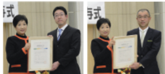
東京都GAP認証証書授与式の様子