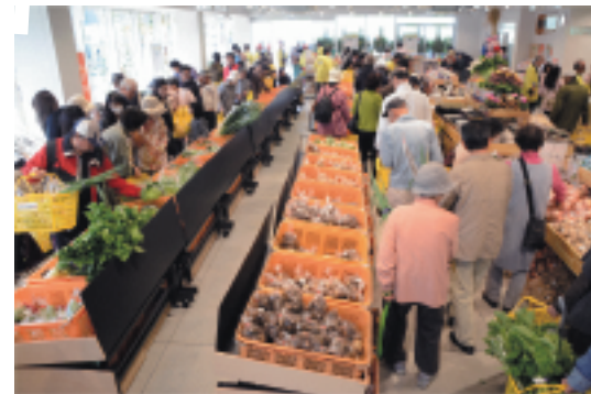
市内の農家から新鮮な野菜や果物が集まります。