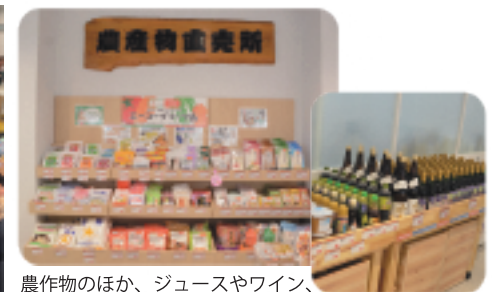
農作物のほか、ジュースやワイン、ジャム、ドレッシングなど加工品も充実しています。またコダイラブランドや洋菓子組合の商品も取り扱っています。