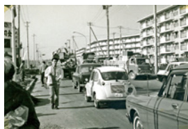
滝山・滝山団地入居はじまる(昭和44・1969年)

9:00~16:30/日曜日・祝日・年末年始休業・臨時休業日 滝山4-3-14 わくわく健康プラザ内/042-472-0051