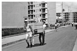
下里・久留米西団地も入居開始