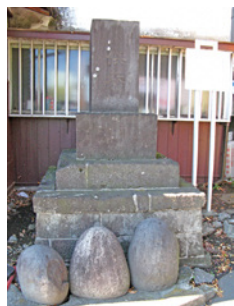
B 石橋供養塔・カ石

在原業平の東下りの伝説にまつわる「笠懸の松」周囲を圧倒して黒松がそびえ、昭和39年(1964)東京都天然記念物となりましたが昭和47年(1972)に落雷の被害にあい、切り株だけを残して伐採されました。現在の松は2代目です。