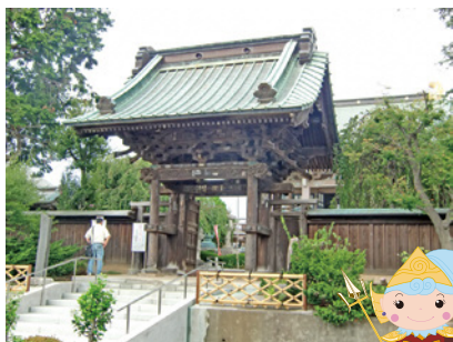
C 多間寺 多間寺山門

嘉永5年(1852)頃に建立。控え柱上部の獅子鼻などの彫刻には、江戸末期の地方建築技術の特徴が表れています。