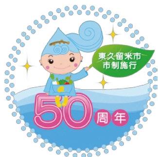
市制施行50周年記念ロゴマーク