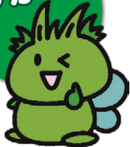
東村山市 公式キャラクター