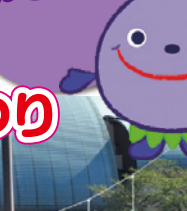
小平市 シンボル キャラクター