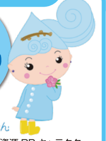
湧水の妖精 るるめちゃん 東久留米市地域資源 PR キャラクター