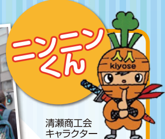
清瀬商工会 キャラクター