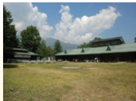
東村山市白州山の家 (山梨県北杜市)