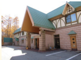
清瀬市立科山荘 (長野県北佐久郡立科町)