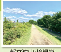
都立狭山・境緑道

11月開催予定 圏域5市の皆さんの貴重な財産である、水と緑の豊かな自然を体験します。自然をいつくしむ心を育み、緑地や水辺環境の再発見をしてみませんか。