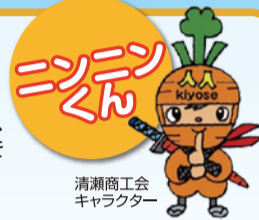
清瀬商工会公式キャラクター

「きよせ Walking Map もっと楽しく健康ウォーキング」から、空堀川・柳瀬川(柳瀬川回廊)の水辺に沿って、野鳥や草花を楽しむコースを紹介します。