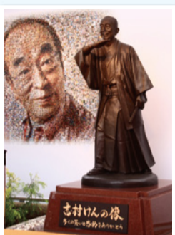
東村山市公式キャラクター