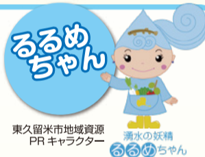
東久留米市地域資源PRキャラクター 清水の妖精 るるめちゃん

「落合川と南沢湧水群」という貴重な湧水と清流や、緑豊かな雑木林で、武蔵野の自然に触れます。