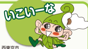
西東京市マスコットキャラクター © シンエイ / 西東京市

西東京市には、市民団体と作成した「みどりの散策マップ・ウォーキングマップ」や、おでかけスポットの情報がつまった「おでかけ図鑑」があります。「おでかけ図鑑」から自然を楽しむルートを紹介합니다。