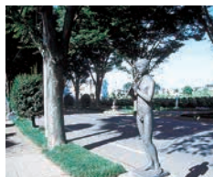
ケヤキロードギャラリー

医療施設が集中する清瀬駅南側。その広大な敷地には緑が多く残され、進める歩は爽快。江戸の昔から流れる野火止用水は必見です。