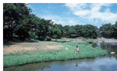
清瀬金山緑地公園