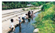
清瀬せせらぎ公園