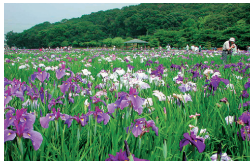
北山公園のハナショウブ

120ヶ所を数えます。また、有機農業への取り組みも早くから行われ、都内で最初に有機農業研究会が組織されました。体験農園が5ヶ所、市民農園が3ヶ所あり、市民の農業とのふれ合いも盛んに行われています。