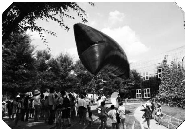
太陽の熱で浮き上がる熱気球実験のようす