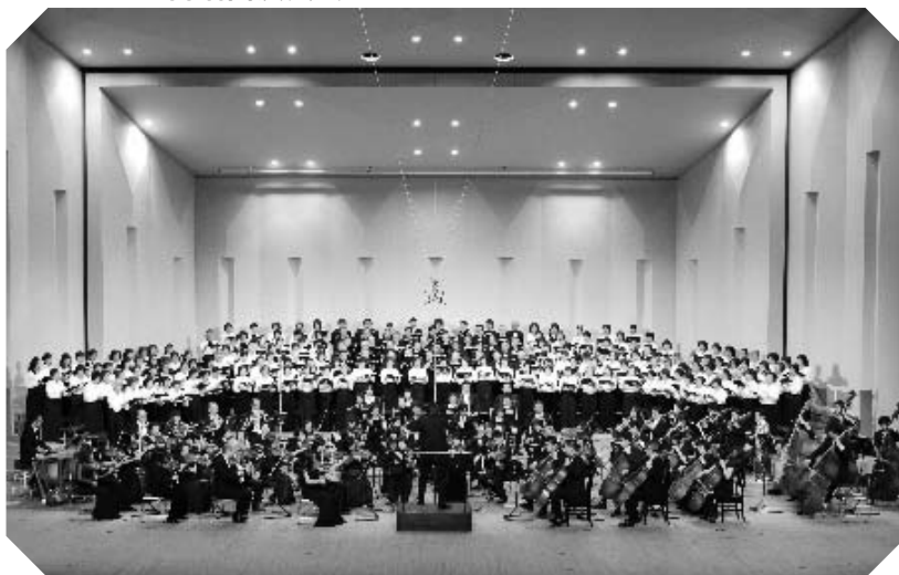
こだいら合唱団演奏会